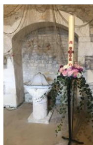
Fond Baptismal et cierge pascal