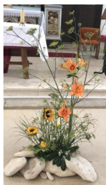
Pierre tu es pierre D L